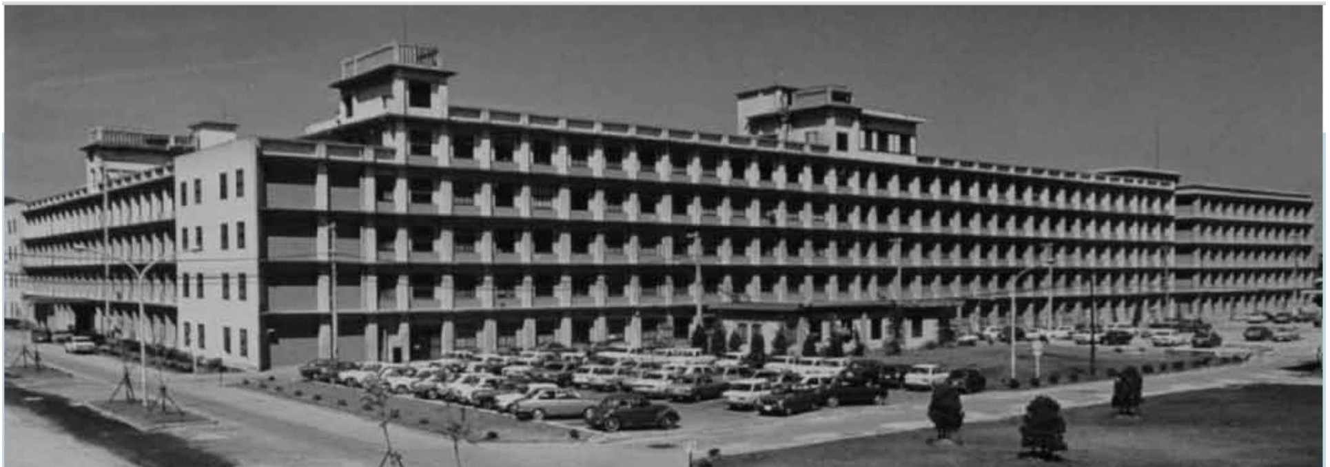
1973(S48)年8月15日基礎工学部全景