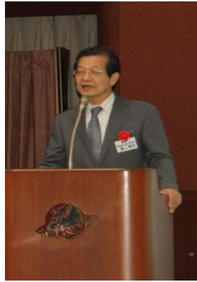
大阪大学名誉教授 奥山雅則様